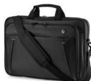
BORSA DA TRASPORTO NOTEBOOK