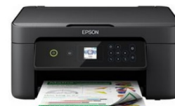
STAMPANTE MULTIFUZIONE INK JET A COLORI